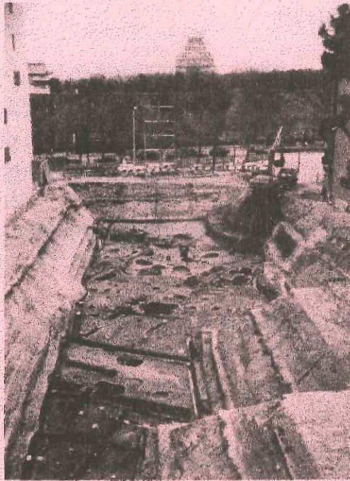
「大坂城三の丸跡」調査状況（西から撮影）