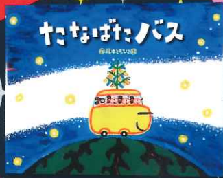
『たなばたバス』 鈴木出版