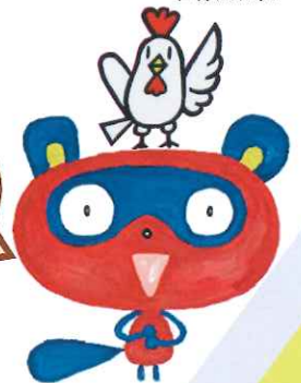
『とんとんとんひげいさん』より ひさかたチャイルド