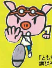
『ともだちたんていコブタンコ』より 講談社

『こんなかいじゅうみたことない』WAVE出版 絵本を読むのが好きで、お部屋もきちんと片付ける かいじゅうがいました。そんなわが子を見て両親は 「こんなかいじゅう、みたことない」となげき、保 育園にあずけることにしました。そこには小さな かいじゅうがいっぱいいて…。