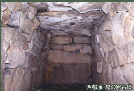
西都原・鬼の窟古墳