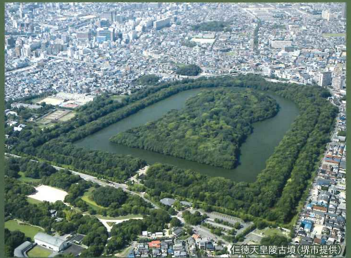
仁徳天皇陵古墳