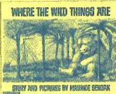
「WHERE THE WILD THINGS ARE」[かいじゅうたちのいるところ] (ラボ教育センター刊 Labo Library シーズ19 より)