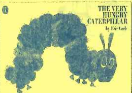
「THE VERY HUNGRY CATERPILLAR」[はらぺこあおむし] (ラボ教育センター刊 Labo Library シーズ20 より)

〈日 時〉 毎週火曜日 15:15～16:15 〈対象〉 幼児～小学生(低学年) 〈会場〉 大阪狭山市コミュニティセンター