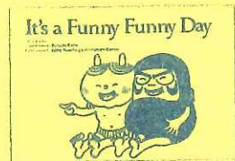
「It's a Funny Funny Day」[だるまちゃんとかみなりちゃん] (ラボ教育センター刊 Labo Library シーズ22 より)